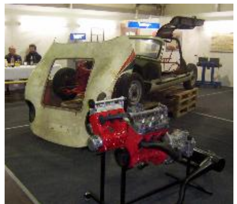
Doppelmotor vor Melkus Nr.2

hatte von diesem Zeitpunkt an nur noch Bereitschaft. Zu meinem Motor muß ich noch ergänzend berichten, daß er bei Außentemperaturen unter 15°C hervorragend läuft, er klingelt dann nicht und bewegt das Auto mit Geschwindigkeiten von 120 km/h vorwärts. (oder mit 33,33333...m/s). Bei der Fahrt von Ost nach West bei allerdings statistisch korrektem leichten Gegenwind war das sehr angenehm. Da nervten mich nur meine über den Winter unförmig gewordenen Reifen, die einfach keinen Gedanken von Laufruhe aufkommen