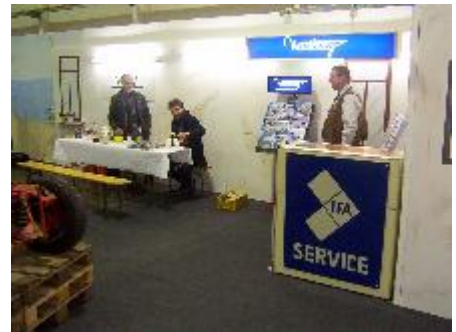
Theke und Ruhezone auf dem Stand

letzten Jahr hatten wir ihm versprochen, daß er seine aufzubauende Maschine auch auf unserem Stand ausstellen kann. Ich hatte das längst wieder ver-