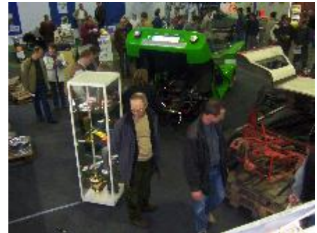
So viel Platz war selten auf dem Stand

Vorbereitungen leider nicht in hohem Maße einbringen. Dafür nehme ich mir für die Messeta-ge Urlaub und hänge noch einen Tag dran, um wenigstens beim Abbau helfen zu können.