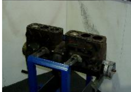
Doppelmotoren V (oben) und Reihe