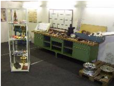
Vitrine und Werkbank mit Teilen

genwind sowieso nicht so schnell sein konnte und wegen der frühlingshaften Außentemperatur von fast 20°C das Motorklingeln unüberhörbar war. Jedenfalls habe ich mich ab