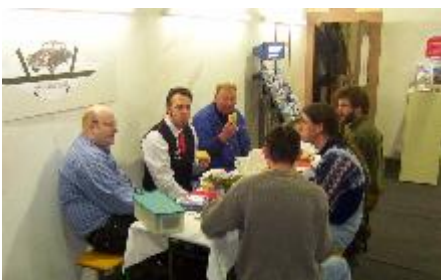
Frühstück auf dem Stand